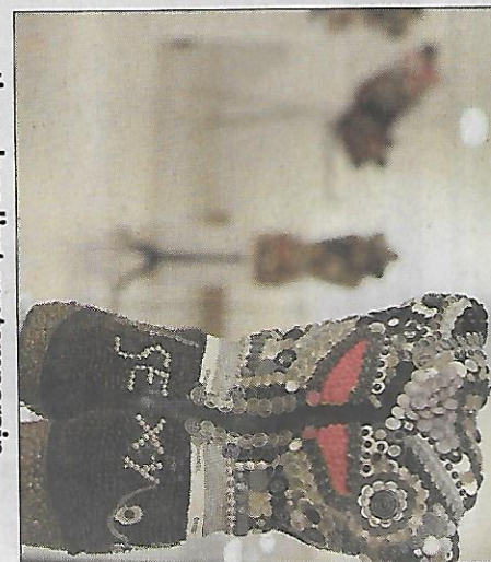
Les tableaux en tissu de Dieter Filler et les bustes ornés de milliers de boutons de Bianca Tosti ouvrent de nouvelles perspectives dans l'art contemporain.