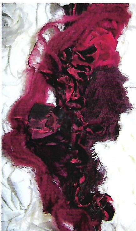
Traces. Dieter Filler. 2017. Textiles divers, laine. Détail de l'œuvre conçue comme un triptyque (80 x 147).

À partir du 11 juillet 8 avenue Boyer 04 92 41 76 73 Du mardi au samedi 10h-12h / 14h-18h